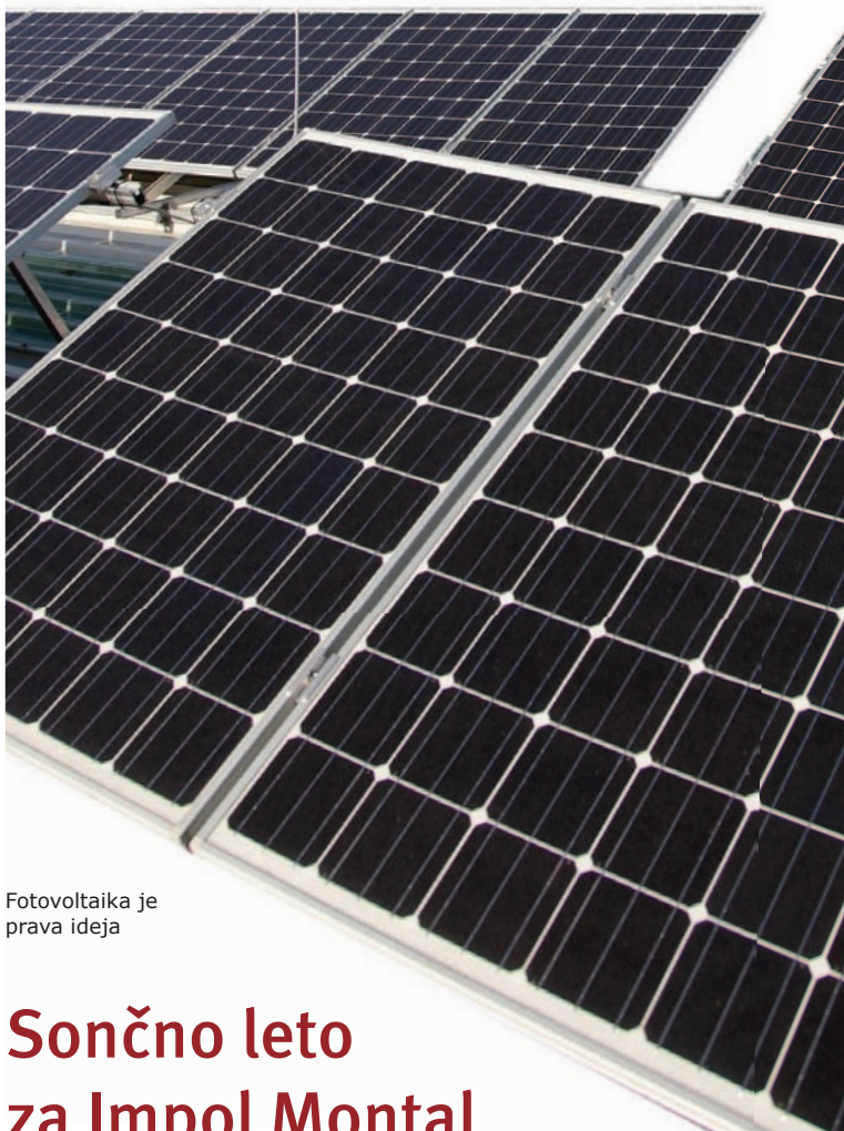
Fotovoltaika je prava ideja