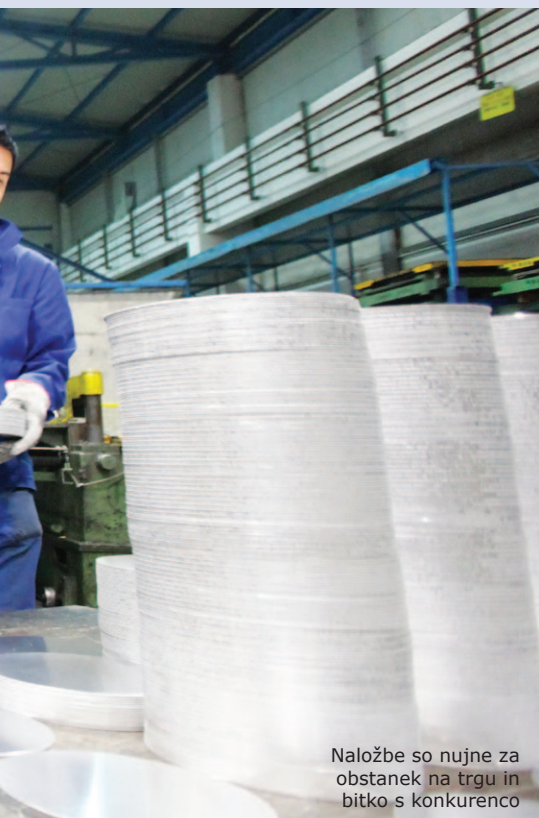
Naložbe so nujne za obstanek na trgu in bitko s konkurenco