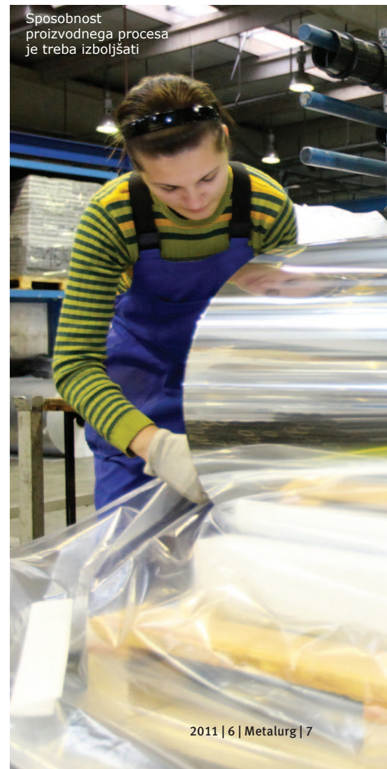
Sposobnost proizvodnega procesa je treba izboljšati

Za zaposlene je vedno koristno in zaželeno, da so s poslovnimi izzivi dobro seznanjeni. Za takšno komuniciranje uporabljamo različne poti, informacije izmenjujemo preko svetov delavcev, sistema kolegijev, z medsebojnimi razgovori, »odprtimi vrati« za vse zaposlene. Zaposlenim svetujem, da naj sledijo napredku, ki se odvija. V preteklih letih smo precej napredovali in dosegamo dobre rezultate, ampak vedeti moramo, da cilja še nismo dosegli, zato bomo morali produktivnost delovnih skupin še nadgrajevati in izboljševati. Sam se vedno trudim za odpravo raznih komunikacijskih blokad, ki se med delom pojavljajo, in moram povedati, da se vsi vodje v družbi Impol FT zavedajo, da smo vsi člani ene verige, ki pa je tako močna, kot je močan njen najšibkejši člen.