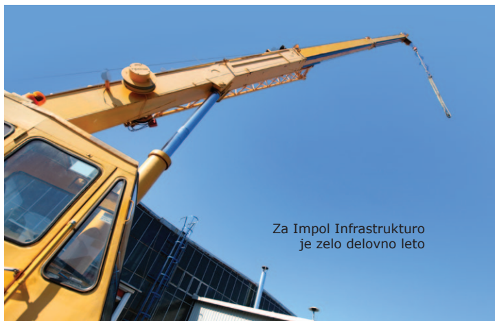
Za Impol Infrastrukturo je zelo delovno leto

Zame je bilo leto 2011 leto izzivov. Sicer se moram naučiti še boljše razlikovati med službo in prostim časom. Uspešnost mojega dela pa naj ocenjujejo drugi.